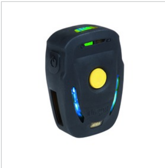
Dräger Bodyguard® 1000

Giyen kişinin hareketsiz veya zor bir durumda kalması durumunda takımı uyararak hayat kurtarmak için tasarlanmış olan Dräger Bodyguard® 1000, en kötü çevresel koşullarda bile hızlı ve etkili tanınmayı sağlamak üzere net ve ayırt edilebilir sinyaller ve alarmlar gönderir.