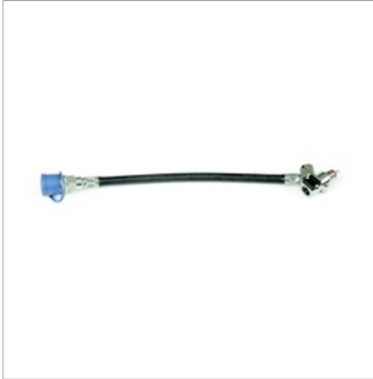
İkincil kaynak hortumu