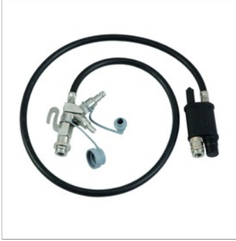
ASV'li Havayolu Kemer manifoldu