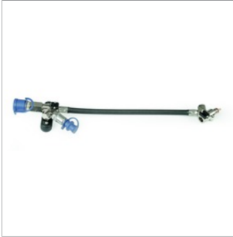
İkinci orta basınç kombine konnektör